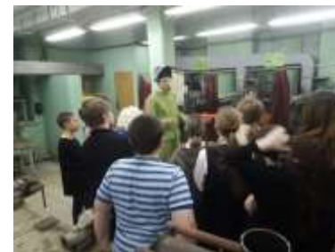
8а - Кинешемский политехнический колледж

С этой целью ученики нашей школы ежемесячно посещают различные профессиональные учебные учреждения, а также организации и предприятия нашего города.