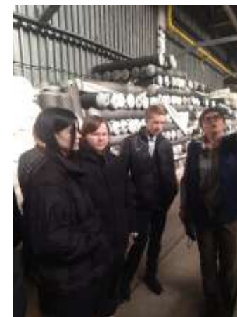
9а и 9б - ООО «Блекрам»