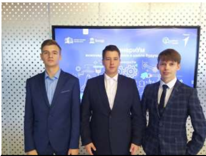
Участие в конференции проектно – исследовательских работ инженерных классов в центре для одаренных детей в городе Иваново.