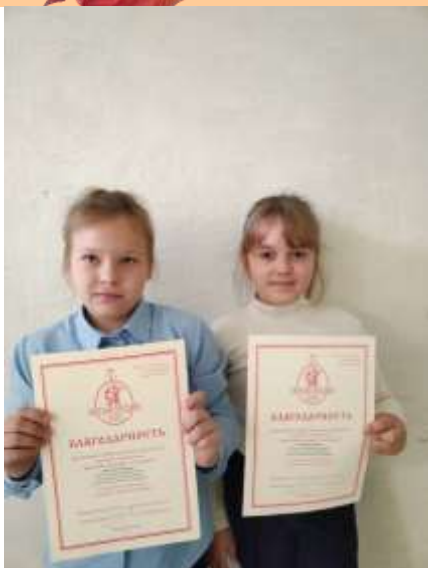
XXII фестиваль детского творчества «Светлый Праздник»