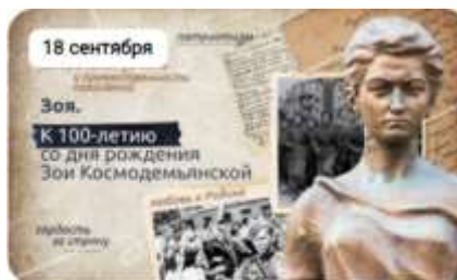
К 100-летию со дня рождения Зои Космодемьянской