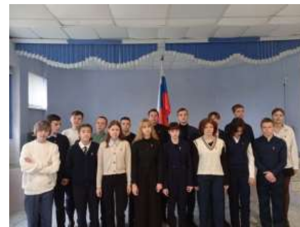
Посвящение в «Движение Первых»